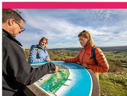
Table d'orientation de Saint-Clément-sur-Guye

La demeure des Marquis d'Huxelles, édifiée de 1606 à 1625, abrite le plus fastueux appartement Louis XIII conservé en France. Cheminées, plafonds et boiseries ont été peints, sculptés et dorés avec une magnifique exubérance pour le favori de la reine Marie de Médicis. Tableaux, tapisseries et meubles d'époque complètent cette évocation séduisante de la "vie de château" à l'époque des "Trois Mousquetaires". La visite permet aussi de découvrir un monumental escalier de pierre (20 mètres de haut), une cuisine du XVIII ème siècle et les opulents salons 1900 d'un directeur d'Opéra. Le jardin, dans l'esprit de l'époque baroque, propose sur 12 ha parterres fleuris, grand labyrinthe de buis avec volière-belvédère, potager, théâtre de verdure, pièces d'eau et arbres remarquables.